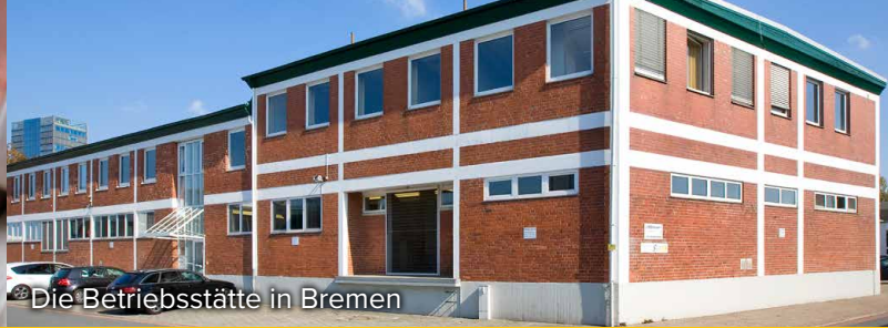
Die Betriebsstätte in Bremen