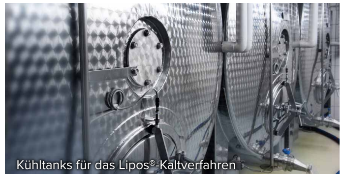
Kühltanks für das Lipos®-Kaltverfahren