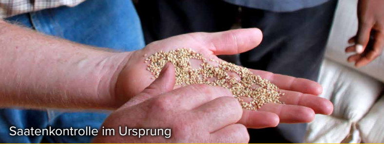
Saatenkontrolle im Ursprung